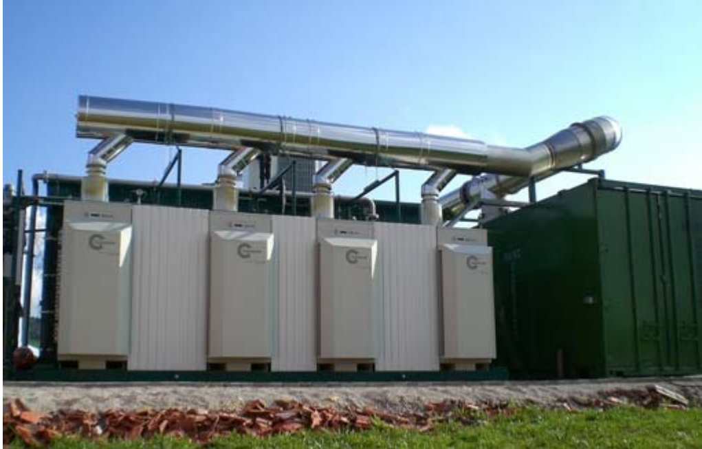
Biogasanlage bei Talheim

Ein Beispiel für ein typisches Projekt von Greenvironmet. In Talheim wurden vier CR65 Mikrogasturbinen installiert. Die Wärme der vier Mikrogasturbinen nutzt der Landwirt, um sein Wohnhaus sowie umliegende Häuser zu heizen.