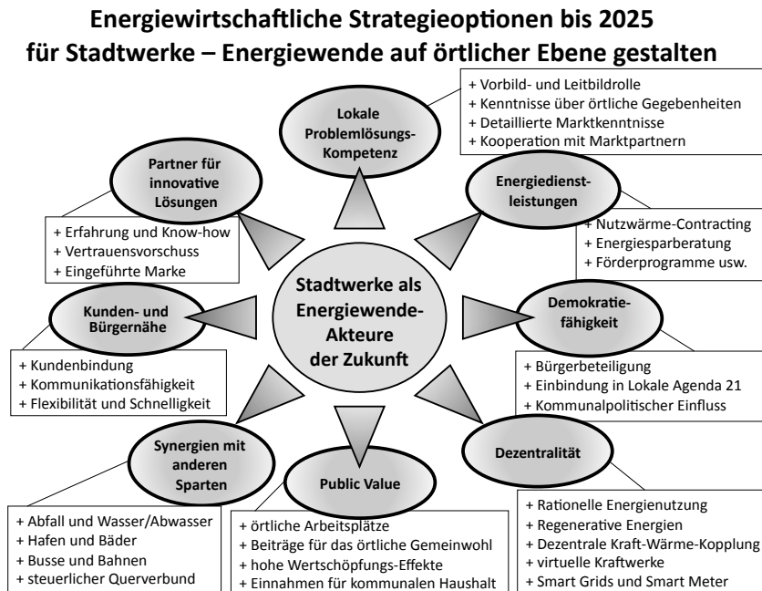
Abbildung 2: Neugegründete Stadtwerke bieten zahlreiche Vorteile und Strategieoptionen im Rahmen der örtlichen Energiewende